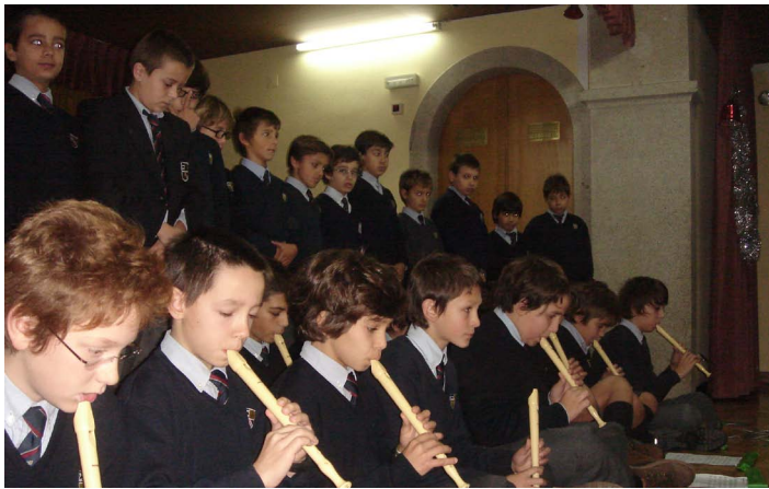
1 Festa de Natal no Lar do Pinheiro Manso