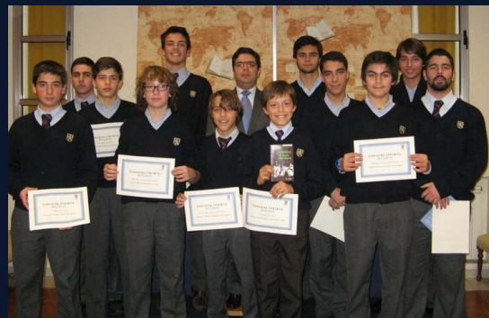
8 Entrega dos Prémio do Concurso Literário (07º ao 12º ano)