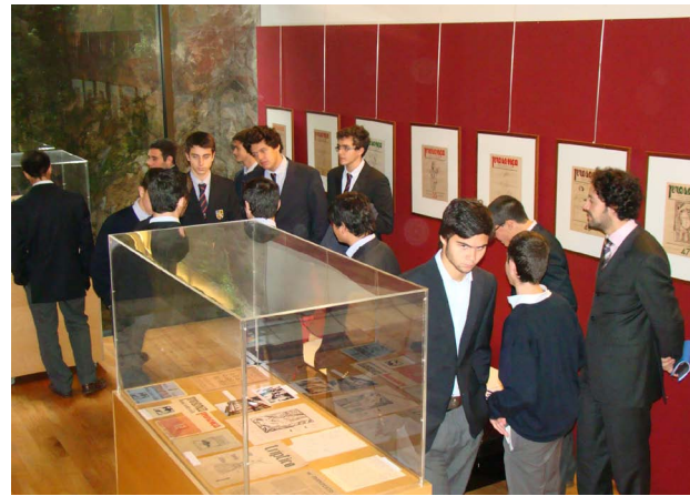
2 Visita de Estudo dos alunos do Secundário