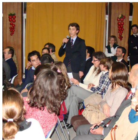
4 Flash Mob de Poesia, na Festa de Natal