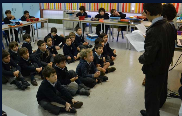
9 Leitura de Contos ao 01º e 02º ano por alunos do 06º ano