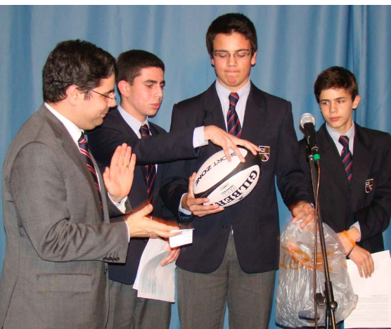
3 Entrega de Prémios do Concurso de Presépios