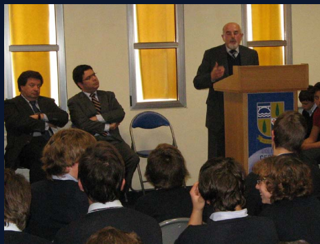
6 Sessão de Poesia