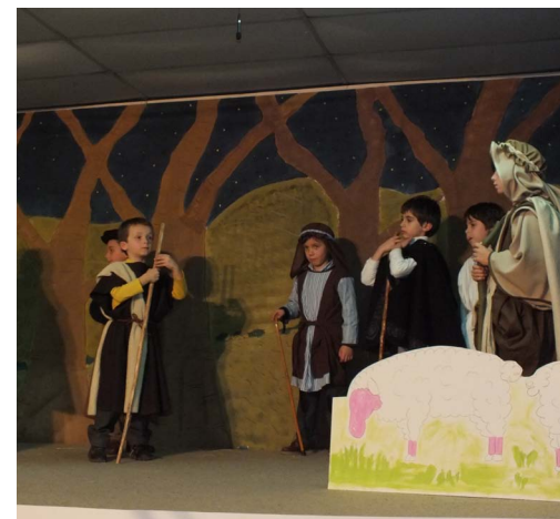
5 Alunos do 1º Ciclo representam os Pastores de Belém